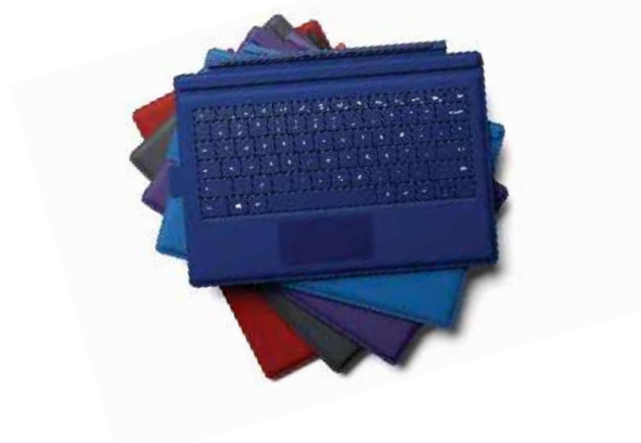
Surface Pro タイプ カバー