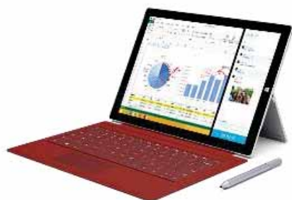
Surface Pro 3